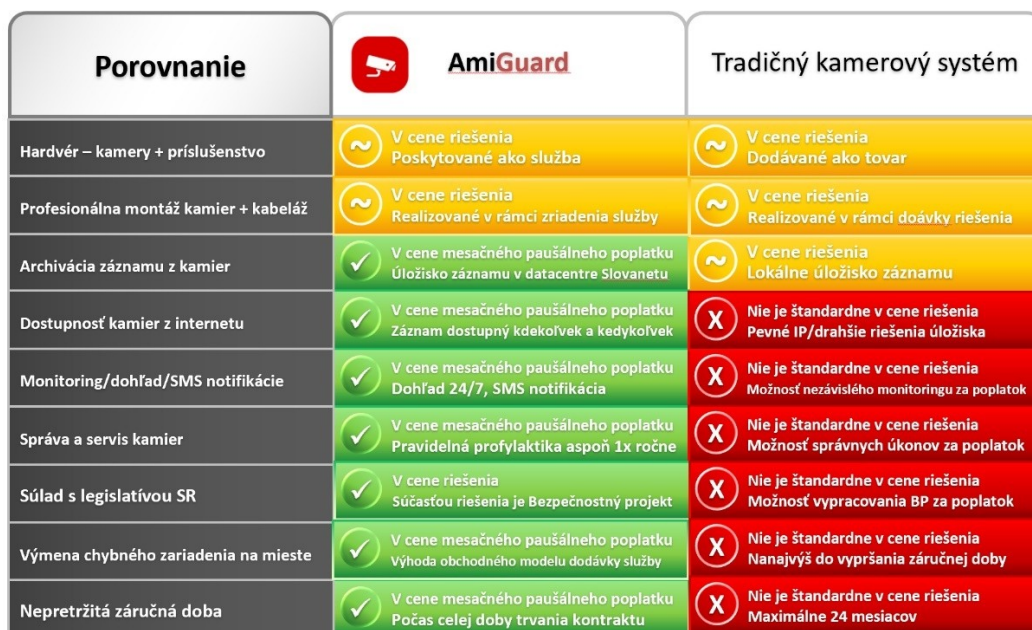
Obr. č. 5 – porovnanie výhod prevádzky cloudového kamerového systému