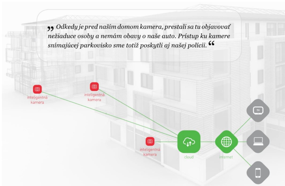
Obr. č 2 –Ilustrácia využitia cloudového kamerového systému

Druhá služba súvisí s prevádzkou cloudového kamerového systému , s ukladaním videoobsahu na 15 dní nielen z kamier, ale i videovrátnikov. Na daný systém je vypracovaný bezpečnostný projekt so striktným dodržiavaním ochrany osobných údajov (GDPR).