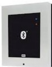
Obr. č 4 – názorná ukážka modulov videovrátnika