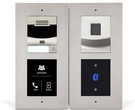
Obr. č. 3 – názorná ukážka modulov videovrátnika

Samotná garáž sa ovláda pomocou zavolania na preddefinované telefónne číslo, kedy sa zopne časové relé a garáž sa otvorí.